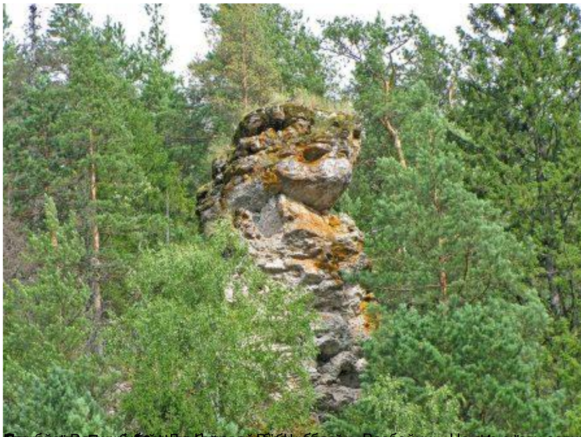
Древний камень в долине реки Свирь. Вид с берега. На фото - естественная каменная арка